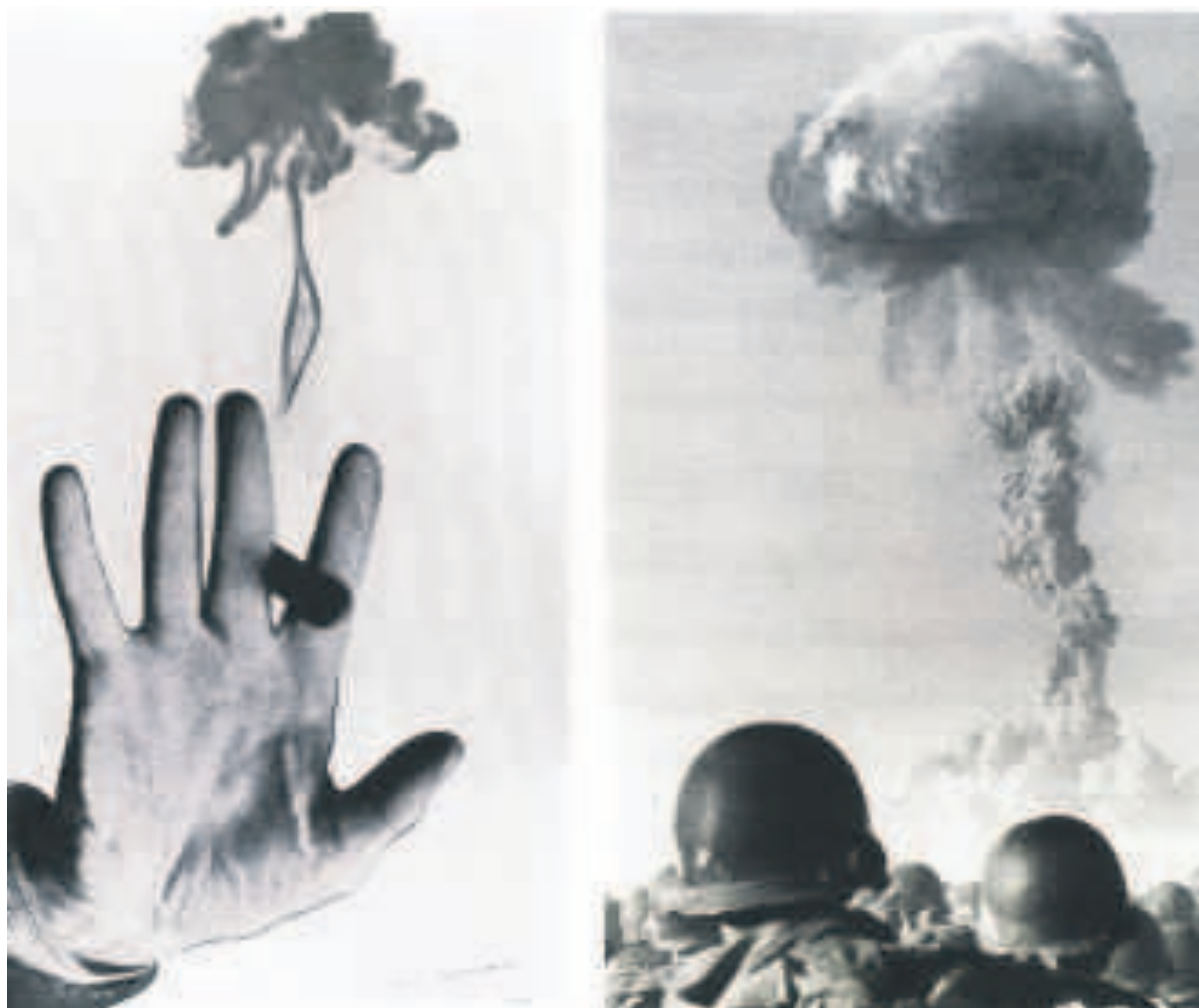
Vaccari «Esplosione nucleare alla presenza di militari, Deserto del Nevada, 1955»

Nata in collaborazione con il Royal Institute of British Architects (Riba) di Londra, la mostra ripercorre, attraverso oltre 100 foto d'epoca di 60 fotografi, quaranta anni di architettura italiana, dal 1926 al 1965, dal Lingotto di Torino al Palazzo dello Sport a Roma.